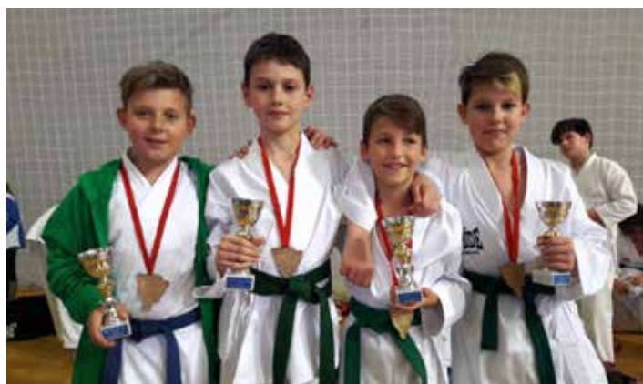
Osvajači prvih mjesta na Eurocupu Istria

žuti, jedan za narančasti i 11 članova za zeleni pojas.